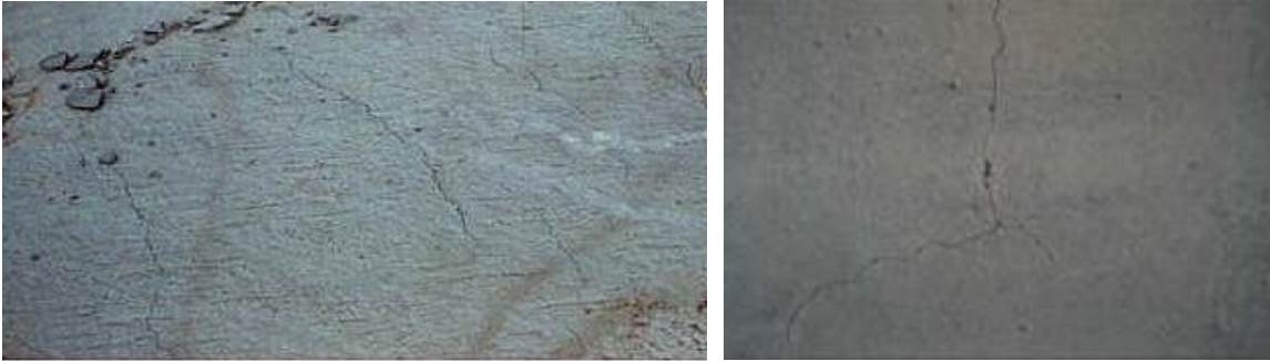
Φωτ 1: Ρηγμάτωση σκυροδέματος σε πλαστική κατάσταση

Για την αποφυγή των ρηγματώσεων αυτών πρέπει να ληφθούν μέτρα που μειώνουν την ταχύτητα εξάτμισης του νερού του σκυροδέματος όπως: