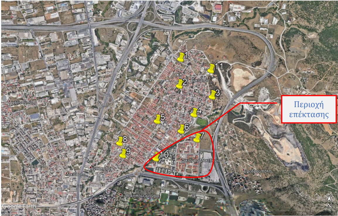
Εικόνα 3: Υπό μελέτη περιοχές στη Δ.Κ. Ευκαρψίας