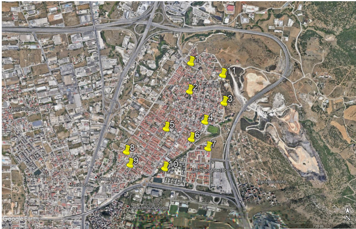
Εικόνα 4: Θέσεις Σχολικών Συγκροτημάτων στη Δ.Κ. Ευκαρπίας

Τα υπό μελέτη οδικά τμήματα περιβάλλουν σχολικές μονάδες - σχολικά συγκροτήματα της Δ.Κ. Ευκαρπίας, τα οποία είναι 11 συνολικά (10 σε λειτουργία και 1 υπό κατασκευή). Η θέση τους, σε σχέση με την ευρύτερη περιοχή, και η κωδικοποίησή τους για τους σκοπούς της παρούσας σύμβασης, παρουσιάζονται στην Εικόνα 4 .