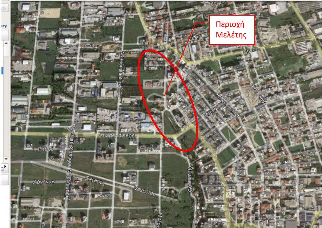
Εικόνα 2: Υπό μελέτη περιοχή στην περιοχή Νικόπολης της Δ.Κ. Σταυρούπολης