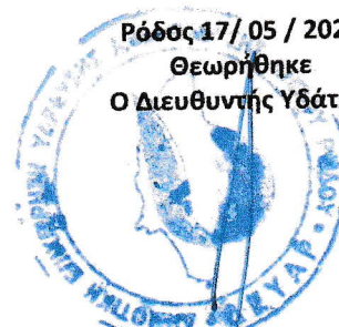
ΠΑΠΑΝΙΚΟΛΑΟΥ ΗΛΙΑΣ Αγρ.Τοπογράφος Μηχανικός ΠΕ