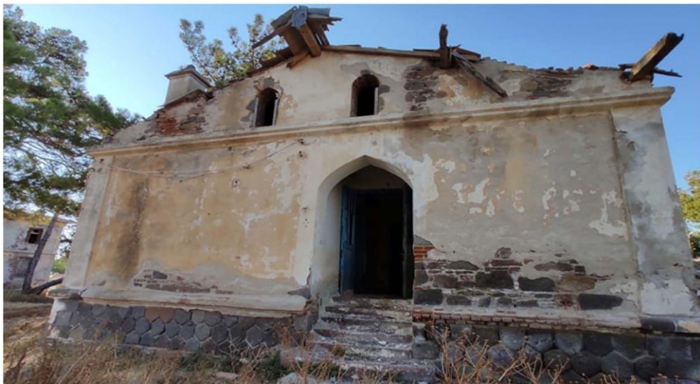
Εικ. 17: Βορειοδυτική όψη συμπληρωματικού κτηρίου A