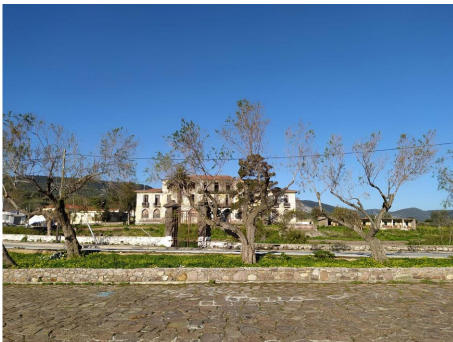
Εικ. 26: Μετωπική λήψη κτηριακού συγκροτήματος Σάρλιτζα Παλλάς από τον χώρο του λιμανιού