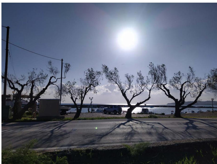
Εικ. 25: Άποψη λιμανιού Παραλίας Θερμής | 22