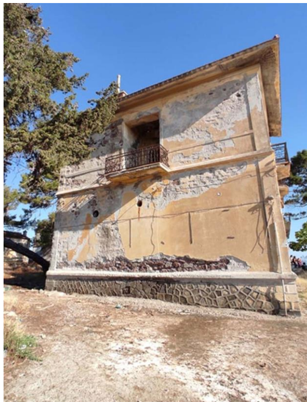
Εικ. 14: Νοτιοανατολική όψη - Σάρλιτζα Παλλάς