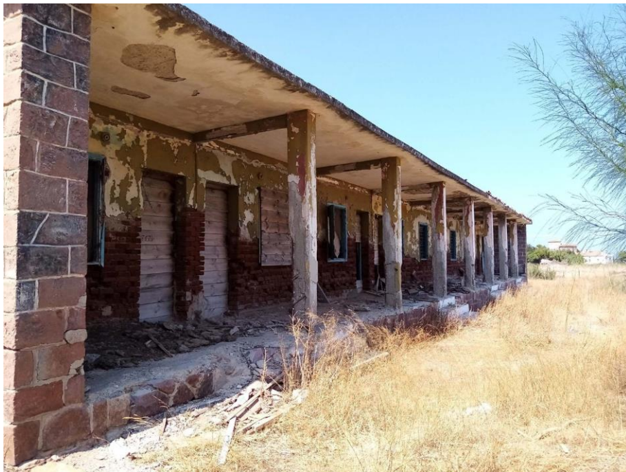
Εικ. 21: Άποψη βορειοανατολικής πλευράς παράπλευρου συγκροτήματος 8 δωματίων