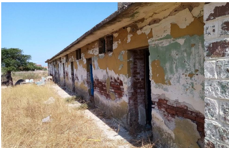
Εικ. 22: Άποψη νοτιοδυτικής πλευράς παράπλευρου συγκροτήματος 8 δωματίων