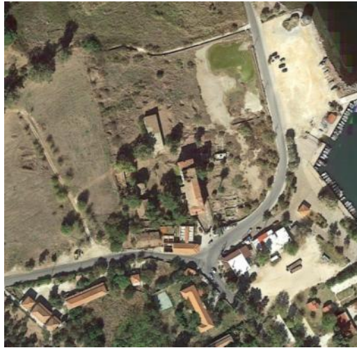
Εικ. 1 + 2: Η ευρύτερη περιοχή της Θερμής (άνω) και το οικόπεδο του αρχιτεκτονικού διαγωνισμού (κάτω)