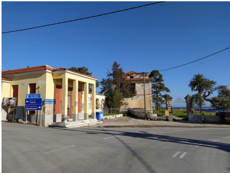
Εικ. 29: Άποψη Σάρλιτζα Παλλάς και παράπλευρου συγκροτήματος λουτρικών εγκαταστάσεων