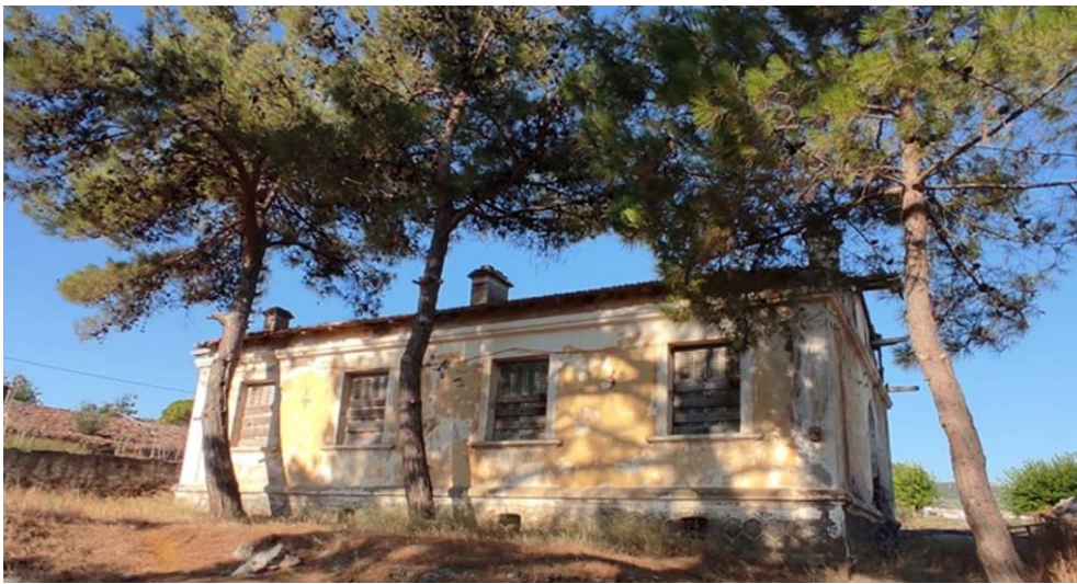
Εικ. 16: Βορειοδυτική όψη συμπληρωματικού κτηρίου A