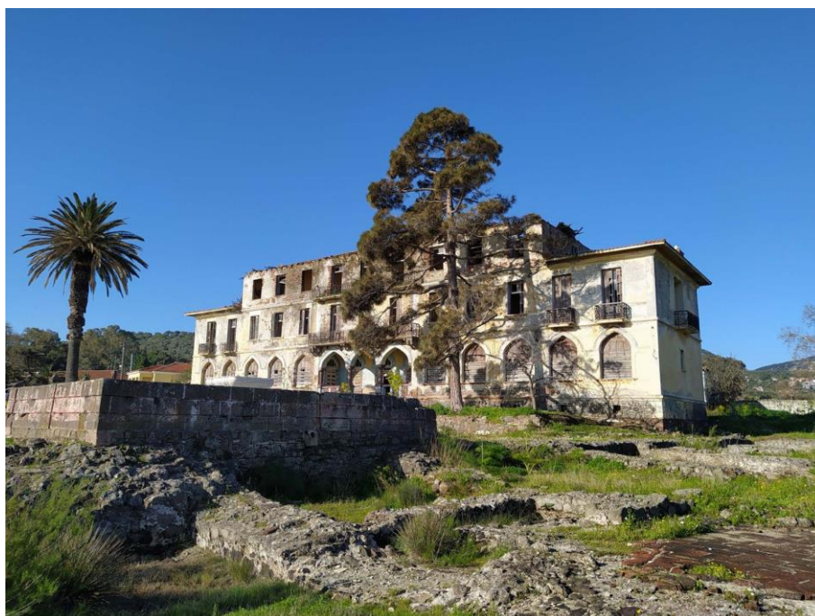
Εικ. 27: Άποψη αναβρυτηρίου, αρχαιολογικών ευρημάτων και κτηρίου Σάρλιτζα Παλλάς