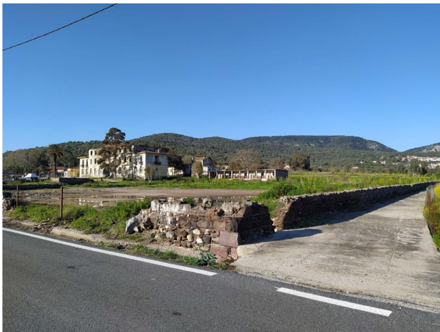
Εικ. 24: Άποψη κτηριακού συγκροτήματος Σάρλιτζα Παλλάς από το βόρειο όριο του οικοπέδου (α)