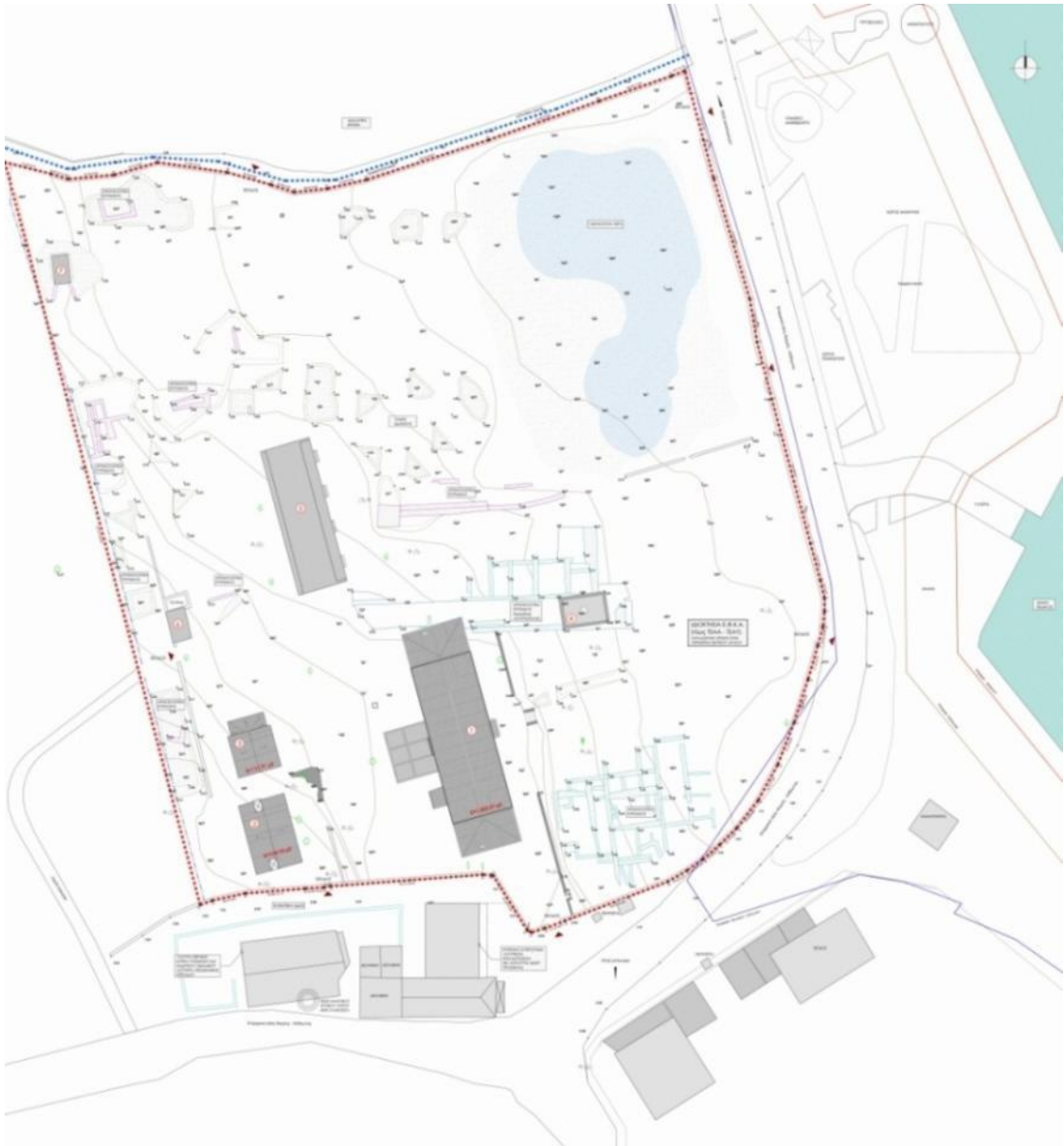
Εικ. 3: Το οικόπεδο του οικοπέδου του Σάρλιτζα και οι γύρω χώροι.