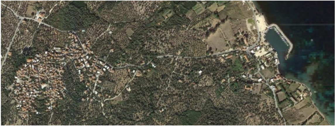
Η ευρύτερη περιοχή της Θερμής