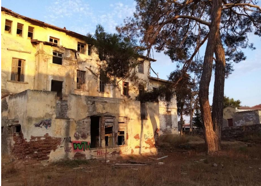
Εικ. 11: Άποψη κτίσματος ιαματικών λουτρών – Πίσω όψη