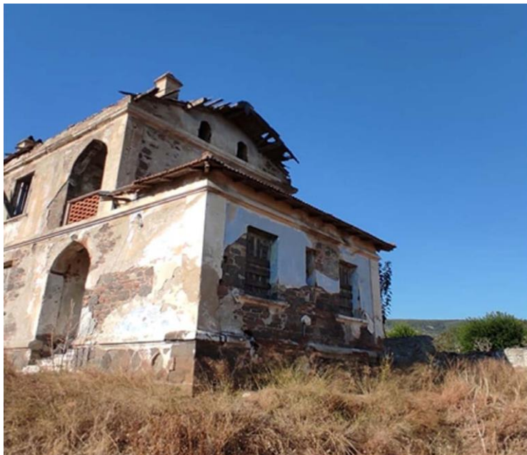
Εικ. 19: Άποψη συμπληρωματικού κτηρίου Β