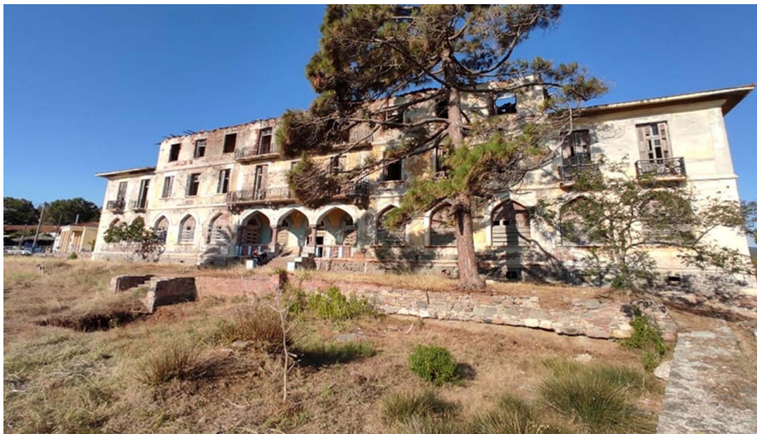
Εικ. 6: Βορειοανατολική όψη Σάρλιτζα Παλλάς - Κύρια όψη (β)