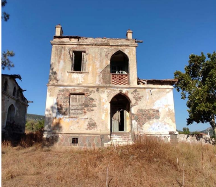
Εικ. 18: Βορειοανατολική όψη συμπληρωματικού κτηρίου Β