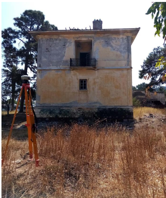
Εικ. 9: Βορειοδυτική όψη Σάρλιτσα Παλλάς