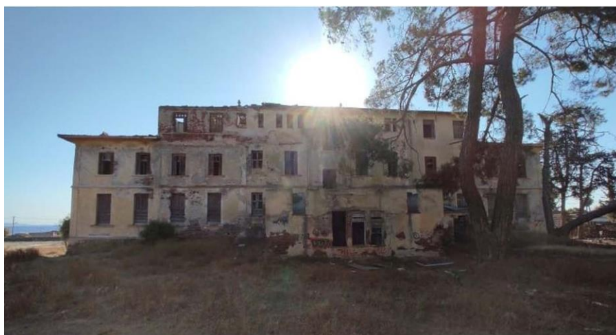
Εικ. 10: Άποψη κτίσματος ιαματικών λουτρών και μεταγενέστερης προσθήκης με αποθηκευτική χρήση