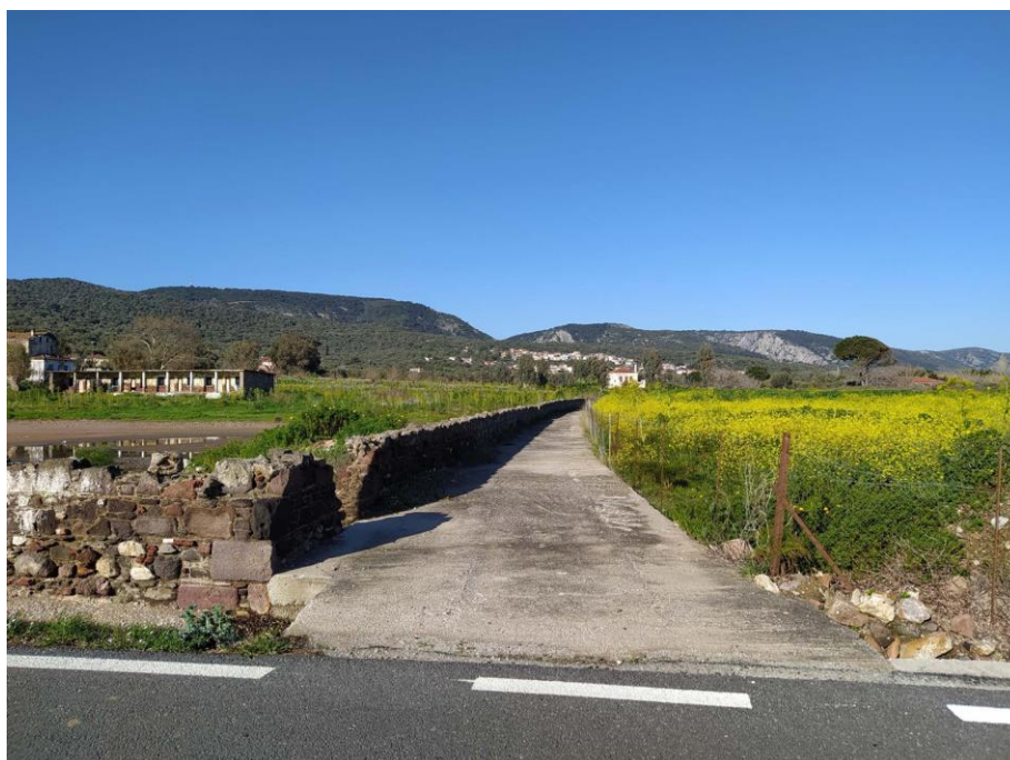
Εικ. 23: Άποψη αγροτικής οδού στο βόρειο τμήμα του οικοπέδου