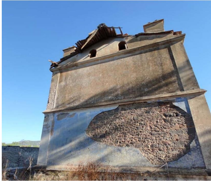
Εικ. 20: Νοτιοανατολική όψη συμπληρωματικού κτηρίου Β