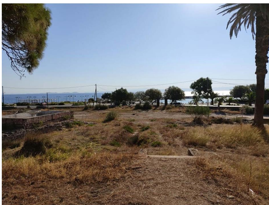
Εικ. 8: Αναβρυτήριο Σάρλιτσα και παραλιακό μέτωπο