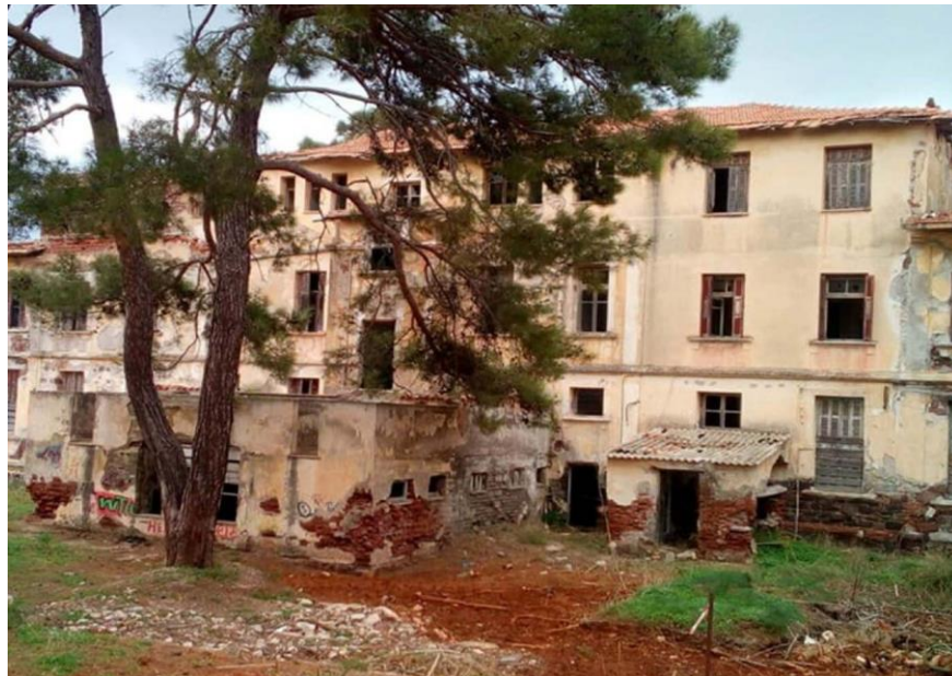
Εικ. 12: Άποψη κτίσματος ιαματικών λουτρών και μεταγενέστερης προσθήκης με αποθηκευτική χρήση