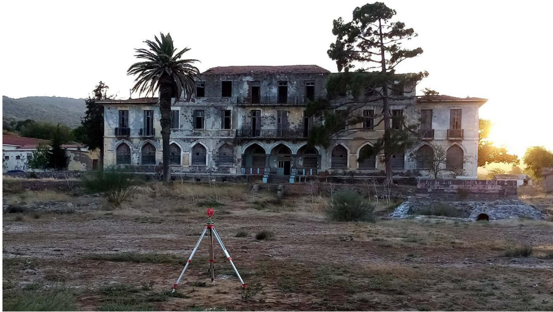
Εικ. 5: Βορειοανατολική όψη Σάρλιτζα Παλλάς - Κύρια όψη (α)