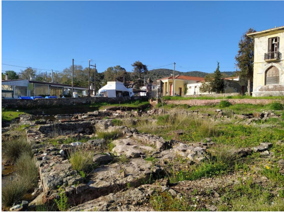
Εικ. 28: Άποψη προς την επαρχιακή οδό Θερμής -Μήθυμνας. Στο βάθος τα κτίσματα του όμορου οικοπέδου: το συγκρότημα λουτρικών εγκαταστάσεων & τα Λουτρά Θερμής (λουτήρας Οθωμανικής περιόδου)