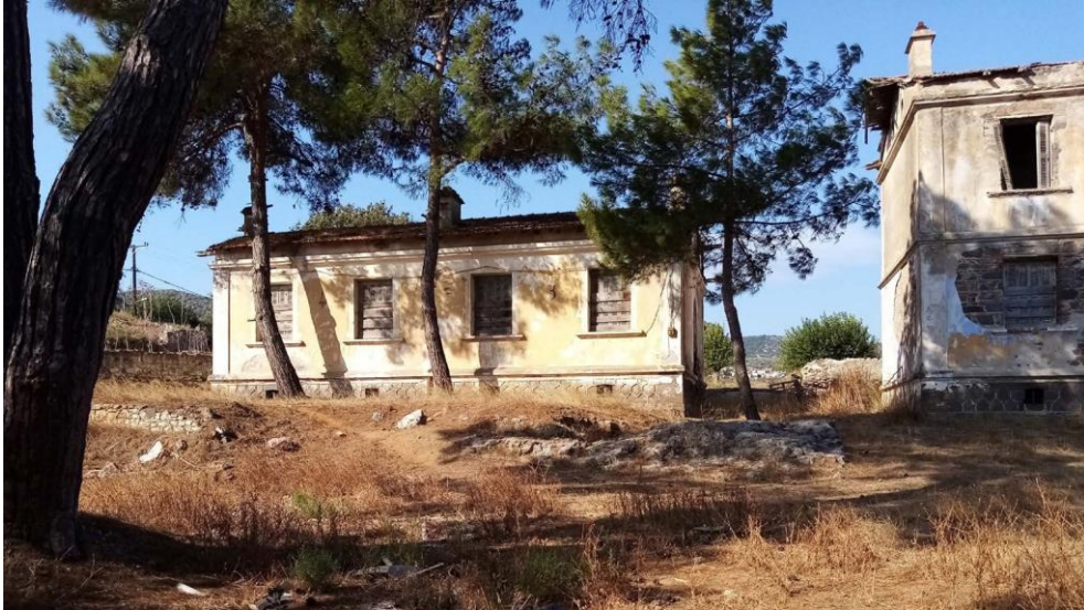
Εικ. 15: Βορειοανατολική όψη συμπληρωματικών κτηρίων A & B