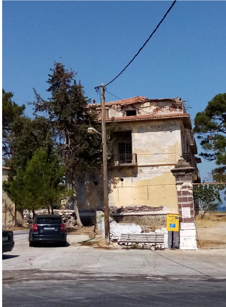
Εικ. 13: Άποψη από την επαρχιακή οδό Θερμής - Μήθυμνας - Νοτιοανατολική όψη Σάρλιτζα Παλλάς