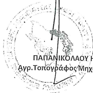
ΠΑΠΑΝΙΚΟΛΑΟΥ ΗΛΙΑΣ Αγρ.Τοπογράφος Μηχανικός ΠΕ