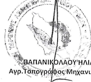
ΠΑΠΑΝΙΚΟΛΑΟΥ ΗΛΙΑΣ Αγρ. Τοπογράφος Μηχανικός ΠΕ