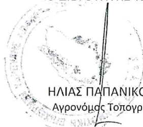
ΗΛΙΑΣ ΠΑΠΑΝΙΚΟΛΑΟΥ Αγρονόμος Τοπογράφος ΠΕ

ΕΛΕΓΧΘΗΚΕ & ΘΕΩΡΗΘΗΚΕ Ο ΔΙΕΥΘΥΝΤΗΣ ΥΔΑΤΩΝ