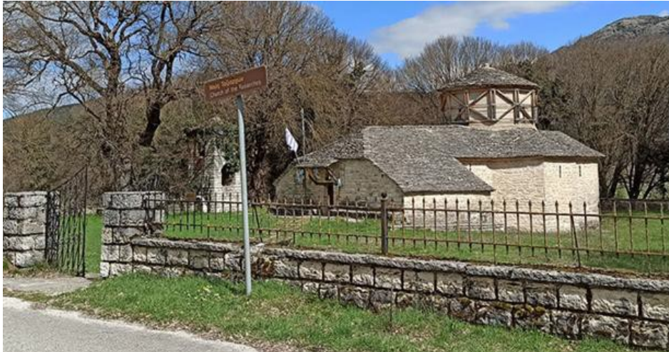
Άποψη του Ναού από την επαρχιακή οδό