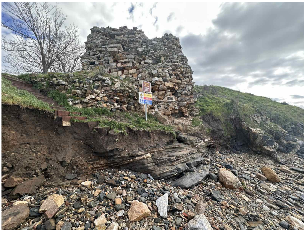
Εικόνα 6 Όψη της νοτιοδυτικής γωνίας (δυτικός προσανατολισμός) του παράλιου πύργου Π3 στις 16 Φεβρουάριου 2026

Επομένως, προκειμένου να εξασφαλισθεί η διαχρονικότητα των επεμβάσεων στον πύργο, απαιτείται ο προσδιορισμός και η αναγνώριση της εδαφικής κατάστασης της περιοχής και η αναζήτηση μεθόδου θεμελίωσης για το προς ανοικοδόμηση τμήμα.