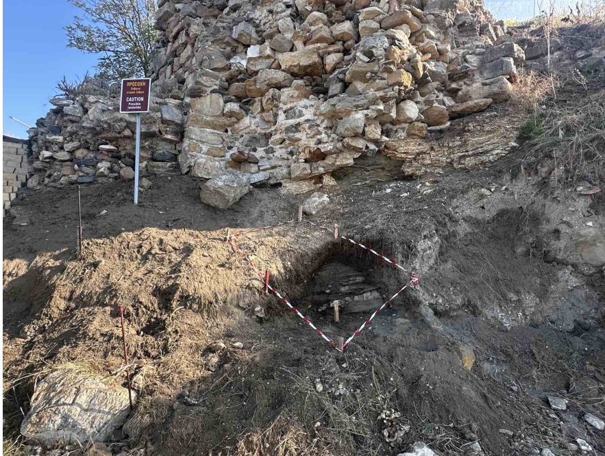
Εικόνα 2 Αρχική δοκιμαστική τομή εδάφους 1x1 μ

Στη διερευνητική τομή που πραγματοποιήθηκε στα νοτιοδυτικά του Π3 από το προσωπικό της Εφορεία μας στις 23 Οκτωβρίου 2025, δεν ήταν δυνατή η εύρεση στρώσης θεμελίωσης της νοτιοδυτικής γωνίας του. Αντιθέτως εντοπίστηκε βραχώδες υπόβαθρο στο οποίο φαίνεται να εδράζεται ο πύργος Π3. Η ύπαρξη του επικλινούς βραχώδους υπόβαθρου σε συνδυασμό με τον παρακείμενο αιγιαλό δημιουργούν δυσχερείς συνθήκες για την απλή εναπόθεση δομικού υλικού και την έναρξη της αναστήλωσης της ανωδομής.