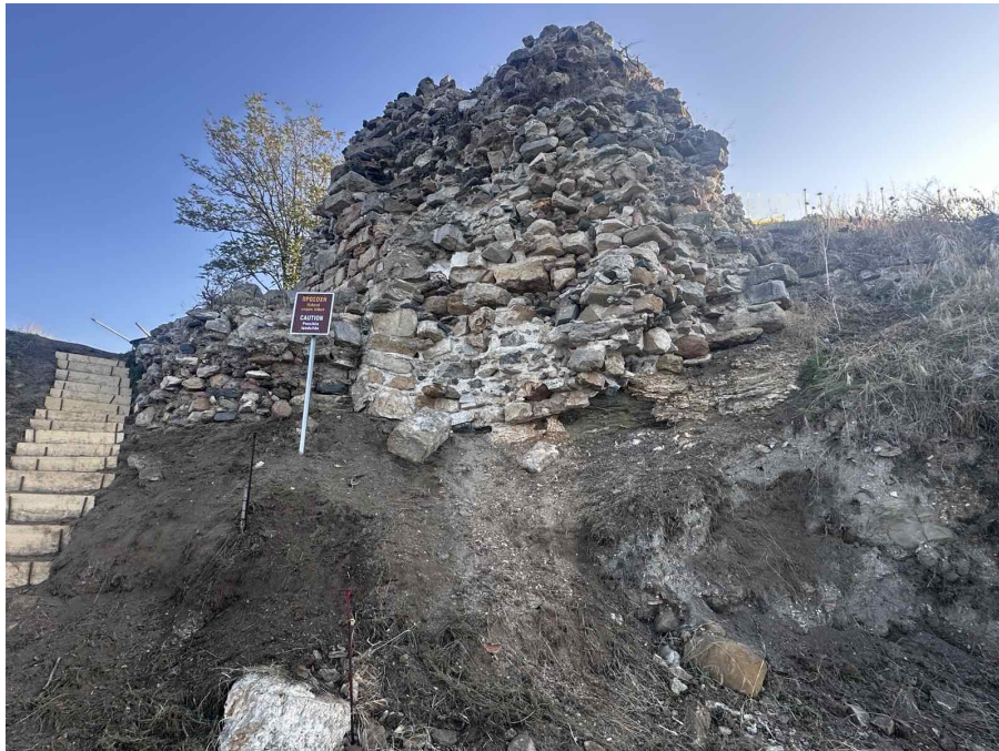
Εικόνα 4 Όψη της νοτιοδυτικής γωνίας του παράλιου πύργου Π3 προ της δοκιμαστική τομή που πραγματοποιήθηκε από την υπηρεσία, Οκτώβριος 2025

Στις 16/2/2026 πραγματοποιήθηκε αυτοψία στη θέση έπειτα από τις έντονες βροχοπτώσεις της περιόδου Ιανουαρίου-Φεβρουαρίου 2026 και καταγράφηκαν οι επιπτώσεις των φαινομένων. Η έντονη νεροποντή και το θαλάσσιο κύμα είχαν ως αποτέλεσμα την αποχρωματώση μεγάλου μέρους του φερτού υλικού που σκεπάζει το βραχώδες υπόβαθρο.