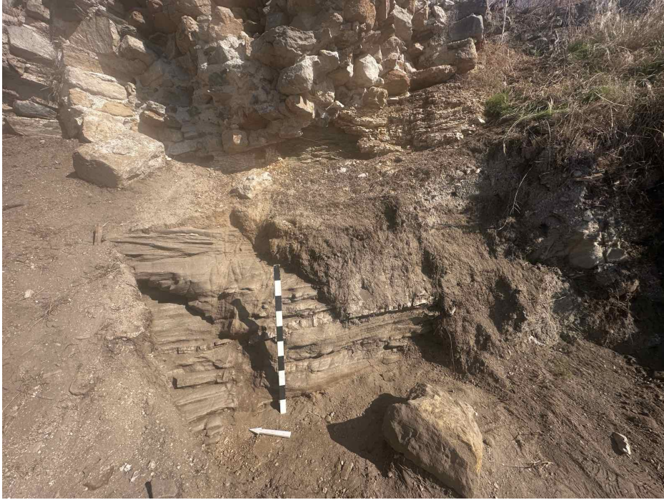
Εικόνα 3 Τελική όψη της δοκιμαστικής τομής έπειτα από διεύρυνσή της

Στις 16/2/2026 πραγματοποιήθηκε αυτοψία στη θέση έπειτα από τις έντονες βροχοπτώσεις της περιόδου Ιανουαρίου-Φεβρουαρίου 2026 και καταγράφηκαν οι επιπτώσεις των φαινομένων. Η έντονη νεροποντή και το θαλάσσιο κύμα είχαν ως αποτέλεσμα την αποχρωματώση μεγάλου μέρους του φερτού υλικού που σκεπάζει το βραχώδες υπόβαθρο.