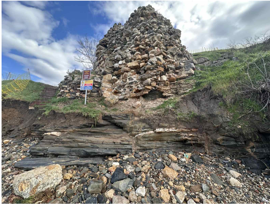
Εικόνα 5 Όψη της νοτιοδυτικής γωνίας (νότιος προσανατολισμός) του παράλιου πύργου Π3 στις 16 Φεβρουάριου 2026