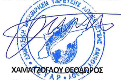
ΧΑΜΑΤΖΟΓΛΟΥ ΘΕΟΔΩΡΟΣ ΠΟΛΙΤΙΚΟΣ ΜΗΧΑΝΙΚΟΣ ΤΕ