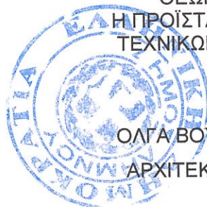
ΟΛΓΑ ΒΟΥΛΓΑΡΟΠΟΥΛΟΥ ΑΡΧΙΤΕΚΤΩΝ ΜΗΧΑΝΙΚΟΣ

ΘΕΩΡΗΘΗΚΕ Η ΠΡΟΪΣΤΑΜΕΝΗ Δ/ΝΣΗΣ ΤΕΧΝΙΚΩΝ ΥΠΗΡΕΣΙΩΝ