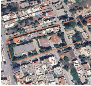
Ο.Τ.332 Δ.Ε. Ελευσίνας

Η σύνταξη των τοπογραφικών διαγραμμάτων περιλαμβάνει: