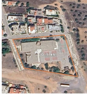
Ο.Τ.45 Δ.Ε. Μαγούλας

Ακολουθεί ενδεικτική απεικόνιση των εκτάσεων προς σύνταξη τοπογραφικών διαγραμμάτων: