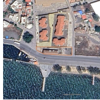
Ο.Τ.40Α Δ.Ε. Ελευσίνας