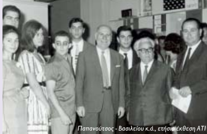
Παπανούτσος - Βασιλείου κ.ά., ετήσια έκθεση ΑΤΙ