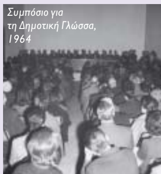
Συμπόσιο για τη Δημοτική Γλώσσα, 1964