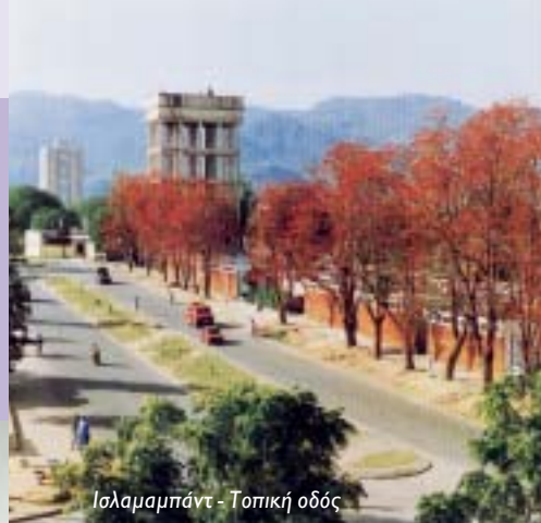
Ισλαμαμπάντ - Τοπική οδός