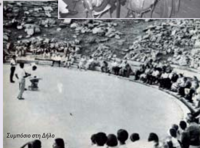
Συμπόσιο στη Δήλο

της Επιτροπής Κατοικίας και Προγραμματισμού του Οικονομικού και Κοινωνικού Συμβουλίου του ΟΗΕ στη Νέα Υόρκη και πρόεδρος της συνεδρίας για τα αστικά προβλήματα στη Διάσκεψη του