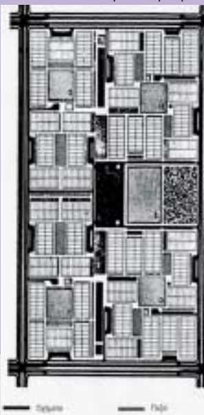
Κοινότητα 4ου βαθμού

Τ α αποτελέσματα των προσπαθειών του Κ.Α. Δοξιάδη στα 40 χρόνια επαγγελματικής δραστηριότητας για τη δημιουργία φιλικών προς τον άνθρωπο και τη φύση οικισμών, όλων των μεγεθών, είναι εμφανή, αλλά μόλις τώρα, σχεδόν 35 χρόνια από τον θάνατό του, μπορούν να αξιολογηθούν οι ιδέες του και να εξαχθούν χρήσιμα συμπεράσματα για τους νεότερους. Και αυτή, σίγουρα, θα ήταν και η επιθυμία του: Να υπάρξει ένα, διαχρονικά, χρήσιμο μέλος της παγκόσμιας κοινωνίας, το οποίο να έχει συμβάλει στη συνεπή διαχείριση του ζωτικού μας χώρου, όπου θα ζήσουν -καλύτερα, όπως ήλπιζε- και οι επόμενες γενεές. Ως τέτοιοι άνθρωποι θα ήθελε να τον θυμόμαστε.