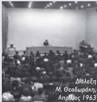
Διάλεξη Μ. Θεοδωράκη, Απριλιος 1963