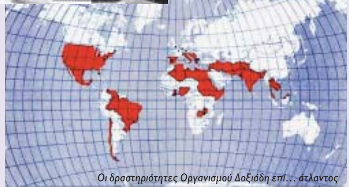
Οι δραστηριότητες Οργανισμού Δοξιάδη επί... άτλαντος

Το 1937 διορίστηκε μηχανικός της Πολεοδομικής Υπηρεσίας της Διοικήσεως Πρωτεύουσας. Από το 1940 έως το 1945 διετέλεσε προϊστάμενος της Πολεοδομικής Υπηρεσίας και προϊστάμενος του Γραφείου Χωροταξικών και Πολεοδομικών Ερευνών και Μελετών (ΓΧΠΜΕ).