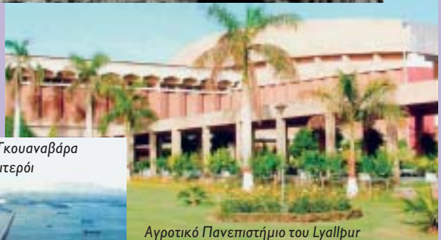
Αγροτικό Πανεπιστήμιο του Lyallpur