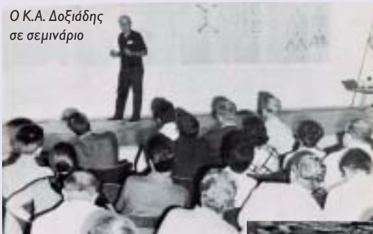
Ο Κ.Α. Δοξιάδης σε σεμινάριο

Ελληνικός Στρατιωτικός Σταυρός για τον πόλεμο 1940-1941 (1941), Παράσημο του Τάγματος της Βρετανικής Αυτοκρατορίας (The Order of the British Empire) για την Εθνική Αντίσταση και τη συνεργασία του με τις Συμμαχικές Δυνάμεις της Μέσης Ανατολής (1945), Παράσημο Τάγματος του Κέδρου του Λιβάνου (The Order of the Cedar of Lebanon) για τις υπηρεσίες αναπτύξεως της χώρας (1958), Σταυρός των Ταξιαρχών του Βασιλικού Τάγματος του Φοίνικος Ελλάδος για τις υπηρεσίες ανάπτυξης της Ελλάδας (1960), «Sir Patrick Abercrombie Award» από τη Διεθνή Ένωση Αρχιτεκτόνων (1963), Χρυσό Μετάλλιο της Ένωσης Μεξικανών Αρχιτεκτόνων, «Cali de Oro» (1963), «Award of Excellence της Industrial Designers Society of America (IDSA)» (1965), «Aspen Award» από το Ινστιτούτο Ανθρωπιστικών Σπουδών Άσπεν (1966), Παράσημο της Γιουγκοσλαβικής Σημαίας με Χρυσό Στεφάνι (1966) και, μετά θάνατον, το 1976, τιμητική απονομή χρυσού μεταλλίου από το «Royal Architectural Institute of Canada».