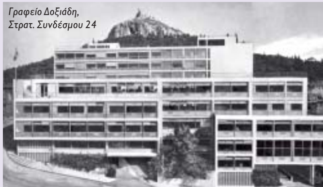
Γραφείο Δοξιάδη, Στρατ. Συνδέσμου 24

Το 1951 εγκατέλειψε τις δημόσιες θέσεις και βγήκε στην ιδιωτική