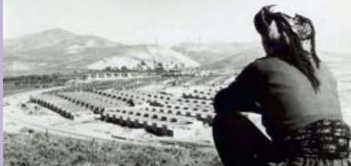
Άποψη της βιομηχανικής πόλης Σαρτσινάφ

Η εφαρμογή σε νέες πόλεις των πολεοδομικών αρχών του Δοξιάδη και η επίδρασή τους στις Μεταφορές και την Κυκλοφορία γίνεται φανερό από το παράδειγμα της νέας πρωτεύουσας του Πακιστάν Ισλαμαμπάντ. Η πρωτεύουσα του Πακιστάν άρχισε να κτίζεται το 1960, δίπλα στην πόλη του Rawalpindi, 300.000 κατοίκων τότε.