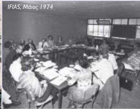
IFIAS, Μάιος 1974

δραστηριότητα την πρώτη στην Ελλάδα Σχολή Τεχνικών Βοηθών/Σχεδιαστών και γενικότερα για την προώθηση της Έρευνας και Εκπαίδευσης, της Τεχνικής Εκπαίδευσης στην Ελλάδα και σε άλλες αναπτυσσόμενες περιοχές, αλλά και εκπαιδευτικών και πολιτιστικών προγραμμάτων.