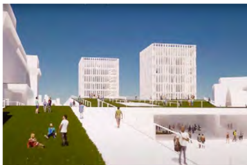
Προϋπολογισμός 36,7 εκ. €, Ενίσχυση Ε.Ε. WBIF 14 εκ. €, αναμενόμενη ολοκλήρωση 2024