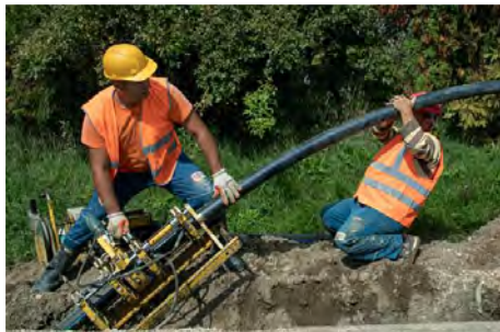
Προϋπολογισμός 32,2 εκ. €, Ενίσχυση WBIF 2,6 εκ. €, αναμενόμενη ολοκλήρωση 2025

Βελτίωση και αποκατάσταση του συστήματος υδροδότησης στο Σεράγεβο. Περιορισμός των διαρροών δια της αντικατάστασης και επισκευής σωληνώσεων, αντλιών και συνδέσεων με νοικοκυριά. Εκτιμώμενο κόστος επένδυσης 32,2 εκ.€ (επιχορήγηση 2,6 εκ.€ από WBIF, επιχορήγηση 0,8 εκ. € από Ε.Ε και συμμετοχή χώρας 0,1 εκ.€). Εκτιμώμενος χρόνος ολοκλήρωσης 2026.