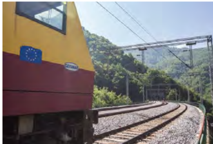
Προϋπολογισμός 226,5 εκ. €, Ενίσχυση Ε.Ε. WBIF 116,5 εκ. €, αναμενόμενη ολοκλήρωση 2029

2. Σιδηροδρομική διασύνδεση Bar (Λιμένας Μαυροβούνιου στην Αδριατική) – Βελιγραδίου, εκσυγχρονισμός και αναβάθμιση του τμήματος Bar – Golubovci, το οποίο αποτελεί επέκταση του αναθεωρημένου Διευρωπαϊκού Δικτύου Μεταφορών - TEN-T (Μαυροβούνιο)