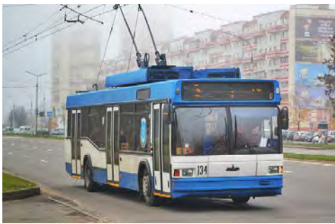
Προϋπολογισμός 111,3 εκ. €, Ενίσχυση Ε.Ε. WBIF 32,1 εκ. €, αναμενόμενη ολοκλήρωση 2029