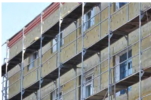
Προϋπολογισμός 27,5 εκ. €, Ενίσχυση Ε.Ε. WBIF 2,2 εκ. €, αναμενόμενη ολοκλήρωση 2025

6. Βελτίωση της ενεργειακής αποτελεσματικότητας κτιρίων (Βόρεια Μακεδονία)