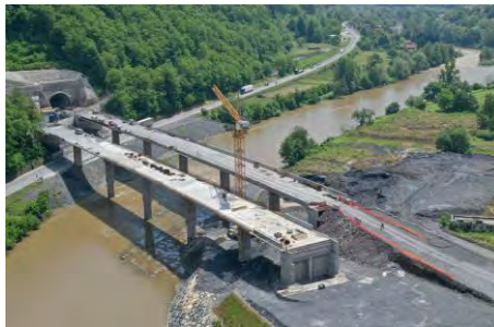
Προϋπολογισμός 383 εκ. €, Ενίσχυση Ε.Ε. WBIF 155,9 εκ. €, αναμενόμενη ολοκλήρωση 2026

2. Οδικός Άξονας Vc, Τμήμα Αυτοκινητοδρόμου Mostar North–Mostar South μήκους 14,2 χλμ. (Βοσνία και Ερζεγοβίνη),