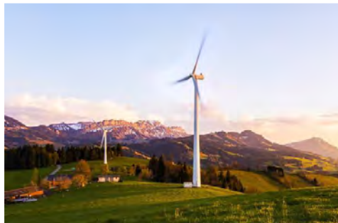
Προϋπολογισμός 90,9 εκ. €, Ενίσχυση Ε.Ε. WBIF 20,9 εκ. €, αναμενόμενη ολοκλήρωση 2028

5. Δημιουργία Αιολικού Πάρκου, εγκατεστημένης ισχύος 50 MW, σε οροπέδιο περιοχής Vlačić. Προβλέπεται να παράγει 112 GWh ηλεκτρικής ενέργειας και να μειώνει τις εκπομπές CO 2 κατά 140.000 τόνους ετησίως (Βοσνία & Ερζεγοβίνη)