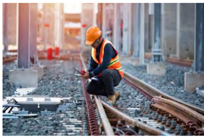
Προϋπολογισμός 494,8 εκ. €, Ενίσχυση Ε.Ε. WBIF 80 εκ. €

14. Ενίσχυσης βιώσιμης ασφάλειας μεταφορών (Safe and Sustainable Transport Program – SSTP), μέσω βελτίωσης οδικής ασφάλειας, δημιουργίας υποδομών ανεφοδιασμού με εναλλακτικά καύσιμα και ανάπτυξης έξυπνων συστημάτων μεταφορών, σε πλαίσιο πράσινης ατζέντας (Χώρες WB6)