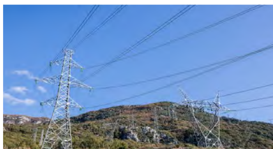
Προϋπολογισμός 36,7 εκ. €, Ενίσχυση Ε.Ε. WBIF 14 εκ. €, αναμενόμενη ολοκλήρωση 2024

7. Ενίσχυση Δικτύου Διανομής Ηλεκτρικής Ενέργειας, προκειμένου να ενσωματώσει ενέργεια από ΑΠΕ, με στόχο την βελτίωση της ενεργειακής ασφάλειας και την μείωση εκπομπών διοξειδίου του άνθρακα (Βόρεια Μακεδονία)