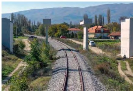
Προϋπολογισμός 36,7 εκ. €, Ενίσχυση Ε.Ε. WBIF 14 εκ. €, αναμενόμενη ολοκλήρωση 2024

3. Οδικός Άξονας VIII, Αυτοκινητόδρομος A2, Τμήμα Kriva Palanka-Stracin μήκους 23 χλμ. (Βόρεια Μακεδονία)