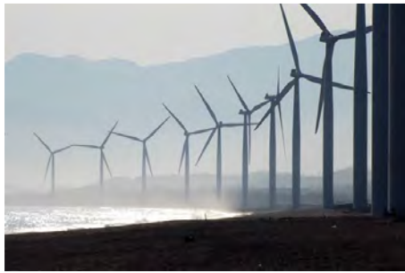
Προϋπολογισμός 200,3 εκ. €, Ενίσχυση Ε.Ε. WBIF 43,7 εκ. €, αναμενόμενη ολοκλήρωση 2027

4. Δημιουργία Αιολικού Πάρκου, εγκατεστημένης ισχύος 132 MW, σε περιοχή Poklečani Δυτικής Βοσνίας & Ερζεγοβίνης. Προβλέπεται να παράγει 436 GWh ηλεκτρικής ενέργειας και να μειώνει τις εκπομπές CO 2 κατά 446.900 τόνους ετησίως (Βοσνία & Ερζεγοβίνη)