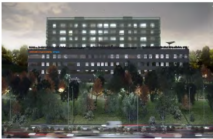
Αναμενόμενη ολοκλήρωση 2026