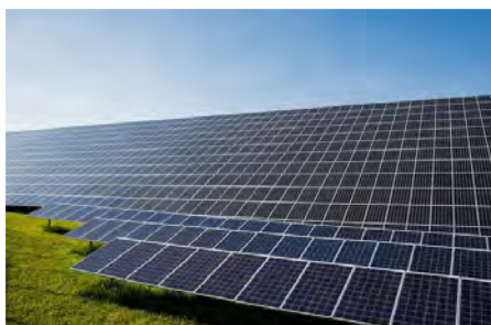
Προϋπολογισμός 41,8 εκ. €, Ενίσχυση Ε.Ε. WBIF 9,6 εκ. €, αναμενόμενη ολοκλήρωση 2026

3. Δημιουργία Φωτοβολταϊκού Πάρκου, ισχύος 50 MW, σε περιοχή Belshë Αλβανίας. Προβλέπεται να παράγει 79 GWh ηλεκτρικής ενέργειας και να μειώνει τις εκπομπές CO 2 κατά 50.000 τόνους ετησίως. Βρίσκεται κοντά στο Belshë στην κεντρική Αλβανία, στην επαρχία Elbasan. Το έργο εκτιμάται σε 41,8 εκ. € εκ των οποίων τα 9,6 εκ.€ είναι επιχορήγηση από το WBIF. Η ΕΤΑΑ έχει εγκρίνει δάνειο ύψους 30 εκ. € ενώ η δικαιούχος KESH πρέπει να συνεισφέρει μόνο 2,2 εκ.€