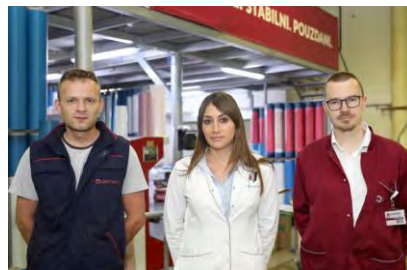
Προϋπολογισμός 40,4 εκ. €, Ενίσχυση Ε.Ε. WBIF 10,4 εκ. €

12. Πρόγραμμα SAFE - Ενίσχυση της βιώσιμης ανάπτυξης μικρών τοπικών εταιρειών (local micro-enterprises/LMEs, με έμφαση στις «κοινωνικές επιχειρήσεις 1 ») μέσω πρόσβασης σε πηγές χρηματοδότησης (Χώρες WB6)