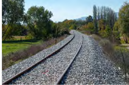
Προϋπολογισμός 120,5 εκ. €, Ενίσχυση Ε.Ε. WBIF 62,6 εκ. €, αναμενόμενη ολοκλήρωση 2028

1. Άξονας VIII (Ανατολική Σιδηροδρομική Παραγεννατία), Τμήμα Σιδηροδρόμου Durrës (Δυρράχιο) – Rrogozhinë, μήκους 33,5 χλμ.. Το έργο αφορά την ανάταξη της γραμμής, ηλεκτροδότηση, σηματοδότηση και εγκατάσταση τηλεπικοινωνίας. Περιλαμβάνεται η επέκταση της γραμμής από Shkozë έως Rrogozhinë, η κατασκευή νέων γεφυρών σύμφωνα με τα ευρωπαϊκά πρότυπα, η κατασκευή 4 νέων σταθμών και η ανακατασκευή του σταθμού Shkozë (Αλβανία). Έχει εγκριθεί η επένδυση από WBIF, ωστόσο η Ευρωπαϊκή Τράπεζα Επενδύσεων δεν έχει ακόμα υπογράψει ενώ εκκρεμεί και η δημοσίευση της προκήρυξης.