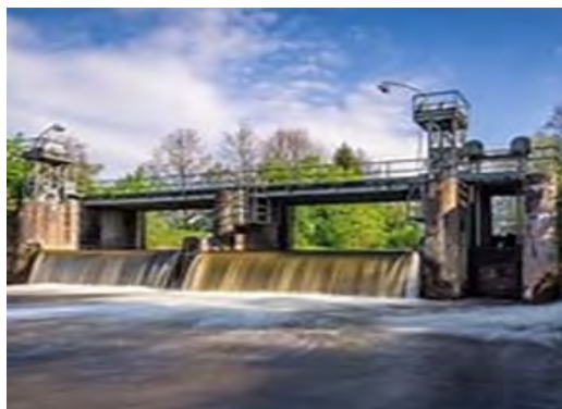
Προϋπολογισμός 77,7 εκ.€ Ενίσχυση Ε.Ε μέσω WBIF 16εκ.€ Αναμενόμενη ολοκλήρωση 2029

5. Εκσυγχρονισμός της Υδροηλεκτρικής Μονάδας Čarljina (Βοσνία και Ερζεγοβίνη), προκειμένου να επεκταθεί η διάρκεια παραγωγικής ζωής της κατά 15 έτη