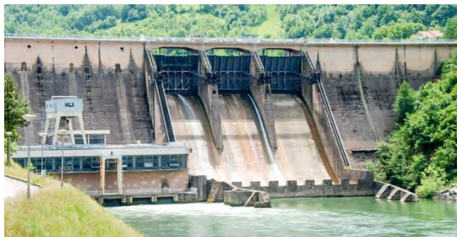
Προϋπολογισμός 40,9 εκ. €, Ενίσχυση Ε.Ε. WBIF 7,7 εκ. €, αναμενόμενη ολοκλήρωση 2028

4. Εκσυγχρονισμός της Υδροηλεκτρικής Μονάδας Bistrica (Σερβία), προς βελτίωση της ενεργειακής αποδοτικότητας και την μείωση των εκπομπών φαινομένου θερμοκηπίου (GHGs)