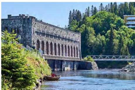
Προϋπολογισμός 18,9 εκ. €, Ενίσχυση Ε.Ε. WBIF 3,1 εκ. €, αναμενόμενη ολοκλήρωση 2026

5. Εκσυγχρονισμός της Υδροηλεκτρικής Μονάδας Čarljina (Βοσνία και Ερζεγοβίνη), προκειμένου να επεκταθεί η διάρκεια παραγωγικής ζωής της κατά 15 έτη