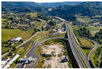
Προϋπολογισμός 354,3 εκ. €, Ενίσχυση Ε.Ε. WBIF 141,4 εκ. €, αναμενόμενη ολοκλήρωση 2026

2. Οδικός Άξονας Vc, Τμήμα Αυτοκινητοδρόμου Mostar North–Mostar South μήκους 14,2 χλμ. (Βοσνία και Ερζεγοβίνη),