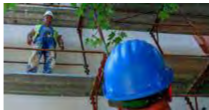
Προϋπολογισμός 231 εκ. €, Ενίσχυση Ε.Ε. WBIF 24 εκ. €

11. Χρηματοδότηση μέτρων βιώσιμης ανάπτυξης και ενεργειακής αποτελεσματικότητας, μέσω του Ταμείου Green for Growth Fund (GGF), με στόχο την μείωση της κατανάλωσης ενέργειας και τον περιορισμό των εκπομπών (Greenhouse Gas Emissions – GHGs) που προκαλούν το φαινόμενο του θερμοκηπίου (Χώρες WB6)