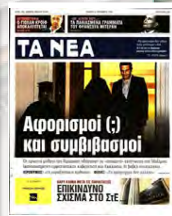
Η παρουσίαση των εφημερίδων γίνεται με αλφαβητική σειρά των λογοτύπων τους.