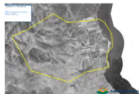
Συνέχεια στη σελ. 12

Για να δούμε όμως τον ιστορικό ορθοφωτοχάρτη της περιοχής Ιστορικός Ορθοφωτοχάρτης της περιοχής