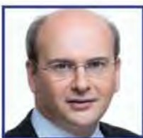
Κωστής Χατζηδάκης Βουλευτής Β' Αθηνών Αντιπρόεδρος Νέα Δημοκρατία