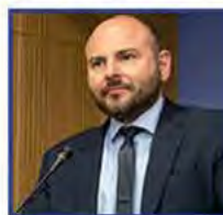
Γεώργιος Στασινός Πρόεδρος ΤΕΕ, Πολιτικός Μηχανικός