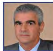
Ασημάκης Παπαγεωργίου Πρώην Υφυπουργός Υπουργείο Περιβάλλοντος, ενέργειας & κλιματικής αλλαγής