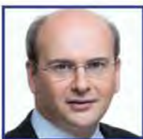
Κωστής Χατζηδάκης Βουλευτής Β' Αθηνών Αντιπρόεδρος Νέα Δημοκρατία