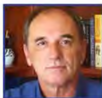
Γιώργος Σταθάκης Υπουργός, Υπουργείο Περιβάλλοντος & Ενέργειας