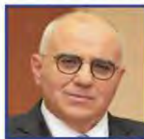
Νικόλητος Β. Καραμούζης Πρόεδρος, Eurobank Ergasias S.A. Πρόεδρος, Ελληνική Ένωση Τραπεζών