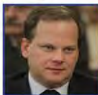
Κωνσταντίνος Α. Καραμανλής Βουλευτής Σερρών, Τομέρχης υποδομών Νέα Δημοκρατία