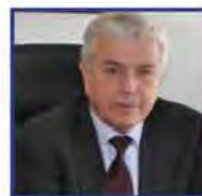
Μανώλης Παναγιωτάκης Πρόεδρος και Διευθύνων Σύμβουλος ΔΕΗ Α.Ε.