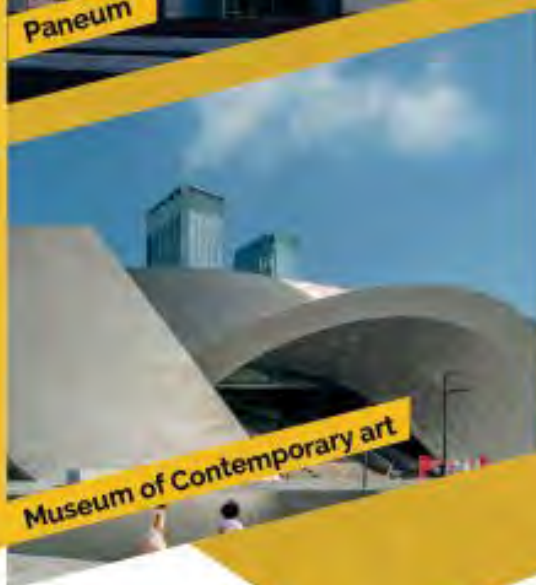
Museum of Contemporary art