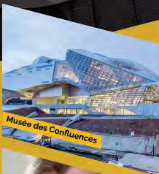
Musée des Confluences