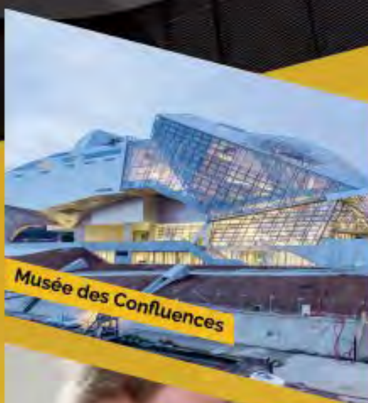
Musée des Confluences