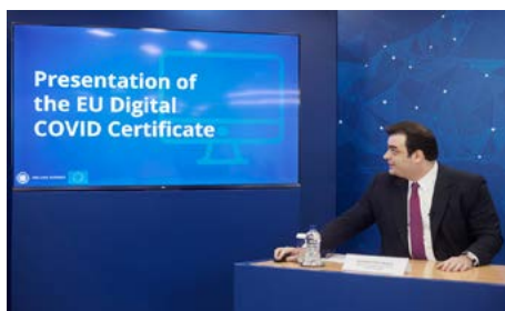
δοκιμές για την τελειοποίησή του.

Το πιστοποιητικό είναι το αποτέλεσμα της πρότασης που κατέθεσε από τις αρχές του έτους ο πρωθυπουργός Κυριάκος Μητσοτάκης, μέσω επιστολής που είχε στείλει στις 12 Ιανουαρίου στην Πρόεδρο της Ευρωπαϊκής Επιτροπής Ούρσουλα Φον ντερ Λάιεν (Ursula von der Leyen), κίνηση που δρομολόγησε συζήτηση της πρότασης και στην τηλεδιάσκεψη του Ευρωπαϊκού Συμβουλίου στις 21 του ίδιου μήνα. Η Ελλάδα έγινε η πρώτη χώρα της ΕΕ που παρουσίασε το πιστοποιητικό, καθώς προχώρησε εξ αρχής με ταχείς ρυθμούς στην ανάπτυξη των ψηφιακών υποδομών που θα απαιτούνταν για την ανάπτυξή του καθώς και στις