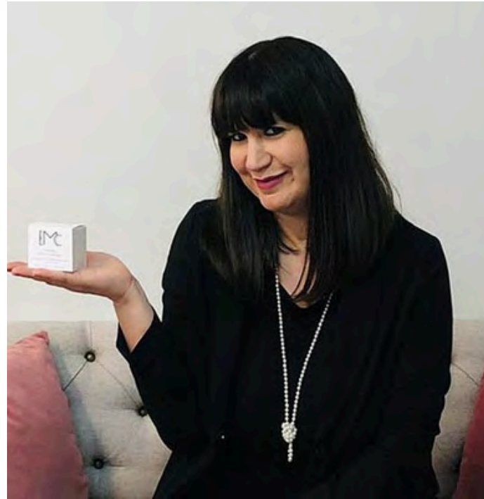
E - Shop & Beauty Store